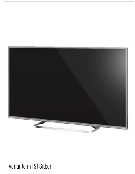
Variante in (S) Silber

*1 24" und 32" mit HDready und anderem Standfußdesign