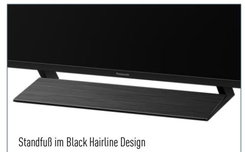
Standfuß im Black Hairline Design